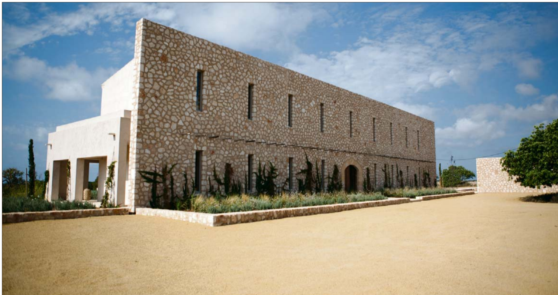
Los ejes son los protagonistas tanto en el exterior como en el interior. Jardines incluidos. Con el muro pétreo como premisa del proyecto.