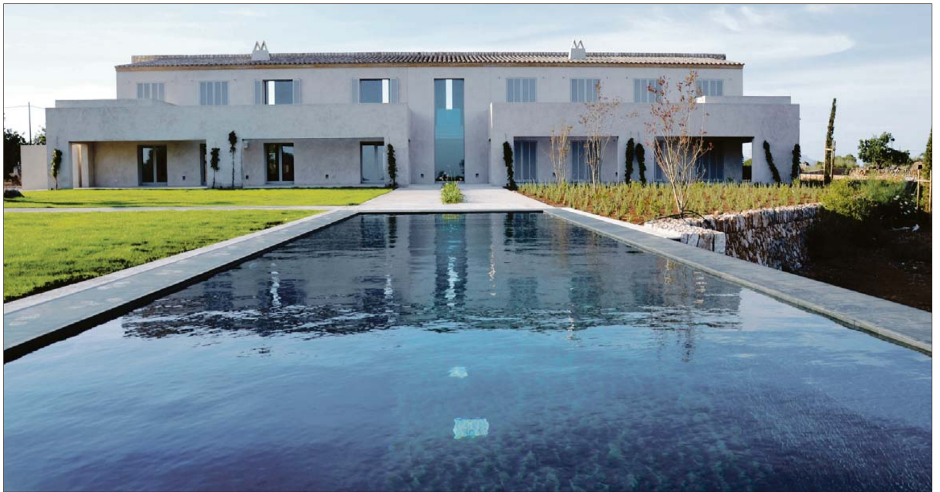
Los jardines y la piscina de excelentes proporciones y oscura, de pizarra gris, y el paisaje como protagonista.

La vivienda esta perfectamente orientada al sur y a las vistas, es simétrica y ordenada como si se tratase de una villa paladina. Los ejes son los protagonistas tanto en el exterior como en el interior. Jardines incluidos. Con el muro pétreo como premisa del proyecto.