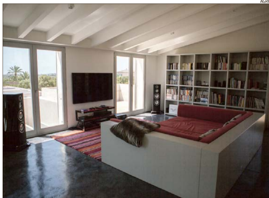
Todas las estancias tienen orientación sur, con vistas.

Todas las estancias tienen orientación sur, con vistas, manteniendo la importante relación con el exterior. Las circulaciones se producen paralelas al muro de piedra con huecos verticales y reducidos dada su orientación y en referencia a las antiguas construc-