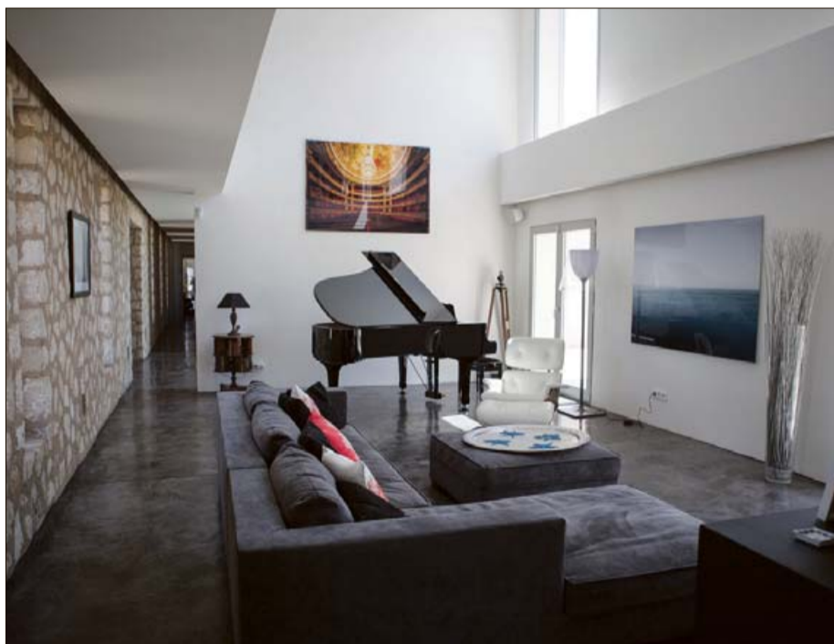
Salón principal a doble altura y con vistas al exterior.

La casa se encuentra en una parcela maravillosa situada en el suroeste de Mallorca, un lugar con encanto especial, en un entorno que te atrapa, que es árido, agreste y casi inhóspito que genera mucha magia. Un lu-